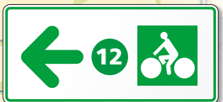
Signalétique directionnelle du parcours