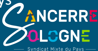
Schéma de Cohérence Territoriale du Pays