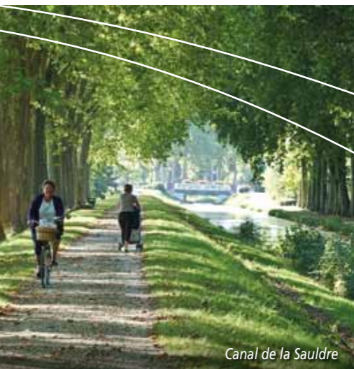
Canal de la Sauldre