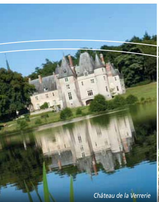
Château de la Verrerie