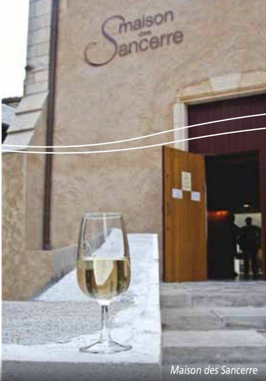
Maison des Sancerre